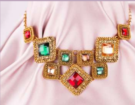
60 verschiedene, große Modeschmuckketten