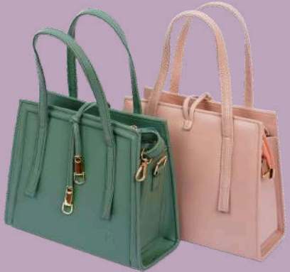
Liebe Taschen ca.40 Stk.