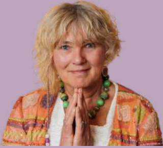
Hamburger Deern von 1.73 cm